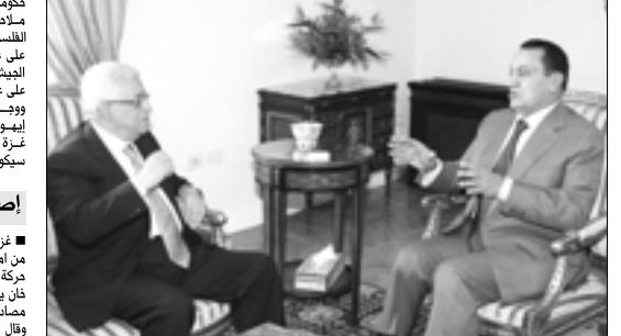
■ الرئيس سميح مبارك مستقلاً الرئيس الفلسطيني محمود عباس

■ غزة - القدس المحتلة - د ب أ - ف ب ا، اكد مسؤول في حركة حماس، امس ان الحركة مستعدة للقيام بخطوة الاولى لانهاء الأزمة الشاخلية الفلسطينية لكن ضمن سياق عام وحل لصفوق اميركية ترفض العودة للحوار مع حماس. ■ وأشار القيادي بالحرية اسماعيل رضوان في تصريحه لوقوع «عرب 48» في ان هناك مبادرات كثيرة سواء من الجانب الفلسطيني أو