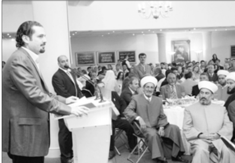
بيروت - السياسة،

■ يحفل الأسبوع الطالع بجداول لقاءات مكثف داخليا وفارجيا عنوانه الاساسي الاستحقاق الرئاسي، حيث تتواصل المشاورات بشأنا عن ايجاد الظروف المناسبة التي تضمن حصول توافق فرعي الاكثرية والمعارضة، على اسم الرئيس المتبدي قبل جلسة 23 أكتوبر المقبل، وهذا ما يتطلب المزيد من البحث والجهود لتضياع التسوية لان العليات والعراقيل التي لا تزال موجودة كبيرة ومتشعبة وهناك من يعمل كما تقول اوساط مؤيولة على وضع العصي في دولاب الحل خدمة لخطط خارجي يريد ابقاء لبنان ساحة صراع مفتوحة.